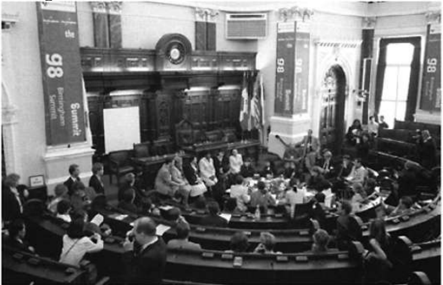
FIGURE 4.5 G8 Birmingham Summit, 1998

Globalisasi politik , adalah tentang cara bahwa negara bangsa sedang digantikan oleh organisasi-organisasi internasional (misal PBB, Uni Eropa) dan munculnya politik global